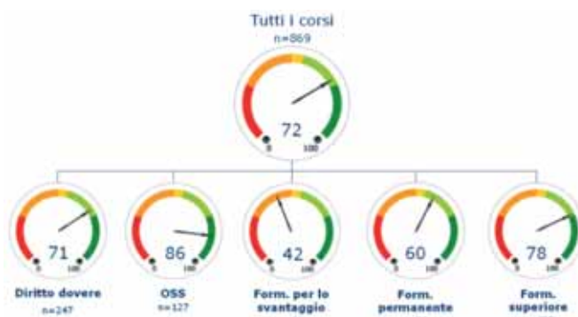
I cruscotti di soddisfazione per tipo di corso

Sono intervistati, con metodologia CATI, circa 2.000 ex-allievi dei corsi di formazione organizzati dalla Provincia di Cuneo per valutarne l'impatto sulla ricerca di lavoro (follow up) e sulla soddisfazione espressa per i vari aspetti dei corsi (contenuti, insegnanti, durata, ecc.). I dati sono stati illustrati con la tecnica dei cruscotti (dashboards, fattori critici di successo).