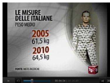
← Variazione delle peso nelle donne