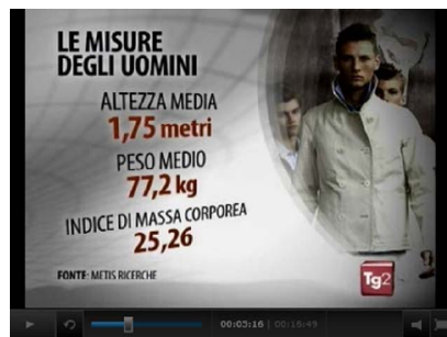
← Il fisico degli italiani